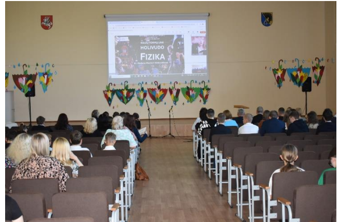
Nuotr. Ekrane nuotolinis pranešimas

ar Žmogų Vorą epizodus akcentavo, kiek fizikos atpažįstama ir kokia fizika slypi už filmo vaizdų, kas remiantis mokslu yra įmanoma, o kas nelabai.