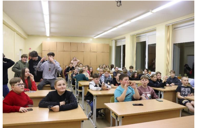
Nuotr. Protmūšio „Mano Lietuva“ dalyviai

Istorijos mokytojai padėjo mums pasirinkti medžiagą ir paruošti protmūšius: 5, 6, 7 klasėms „Mano Lietuva“. 8a, 8b, 9 klasėms „Lietuviais esame mes gimę“ 10, 11, 12 klasėms „Viskas apie Lietuvą“.