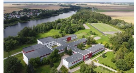
Mokinių pasiekimai ir laimėjimai – 2-3 p.