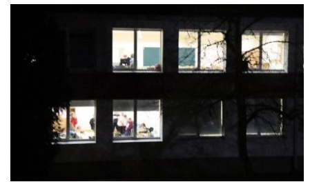
Pilietiškumo renginys „Naktis gimnazijoje“ – 3-4 p.