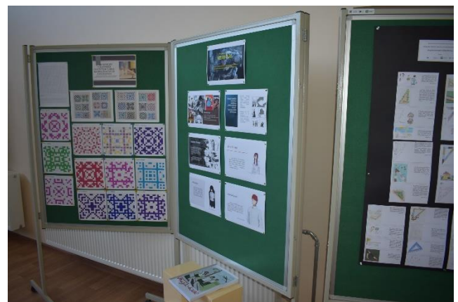
Nuotr. Stendiniai pranešimai