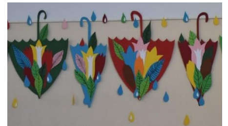
Konferencija „Skaičiai aplink mus“ – 5-6 p.