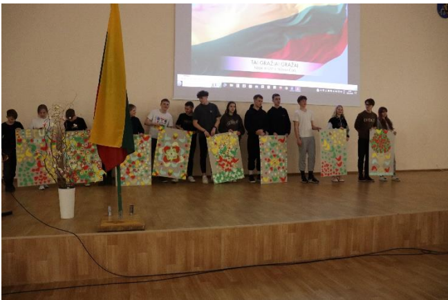
Nuotr. Klasių dovanos Tėvynei Kovo 11-osios proga

Darbus baigėme 23.00 valandą ir visi suėjome į aktų salę. Suplevėsavome Lietuvos vėliava, garbingai įnešta gimnazijos mokinių prezidento, suvirpino širdis iškilmingai sugiedotas himnas. Suskambus Justino Marcinkevičiaus dainai „Tai gražiai gražiai“ buvo įneštos klasių pagamintos dovanos Lietuvai. Visi jautėmės truputį pavargę, bet širdyje buvo gera, nes prie šios šventės prisilietė kiekvienas.