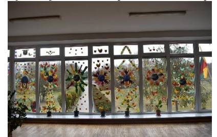
Įvairios pirmokų patirtys – 7 p. Gimnazijos renginių akimirkos – 8 p.