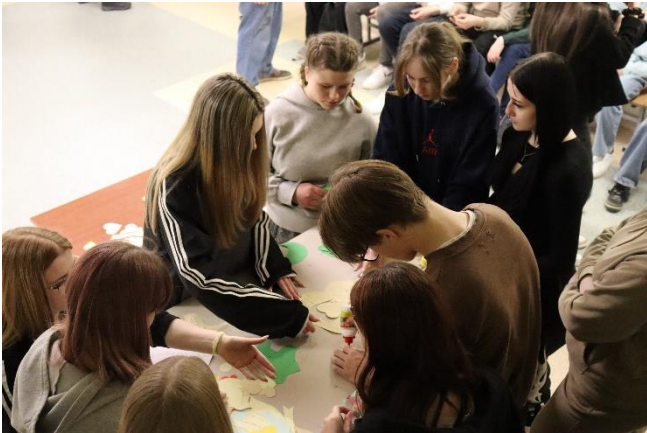
Nuotr. Devintokai gamina dovaną Lietuvai

Kol vieni dalyvavo protmūšiuose, kiti grožėjosi Visata, tretį dirbo kūrybinėse dirbtuvėse ir vadovaujami dailės mokytojos gamino dovaną Lietuvai. Detales dovanai klasės buvo iš anksto pasigaminusios per klasių valandėles. Visoje gimnazijoje naktinis gyvenimas virte virė.