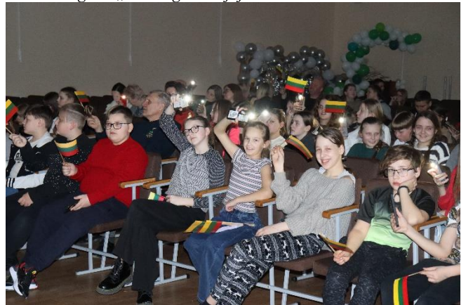
Nuotr. Renginio „Naktis gimnazijoje“ akimirkos

Vėliau mokiniai veiklas pasirinko laisvai: kas norėjo, žaidė sporto salėje, kiti ėjo į diskoteką, tretį žiūrėjo filmus klasėse. Tą naktį mažai kas miegojo, bet prieš akis buvo trys laisvos dienos!